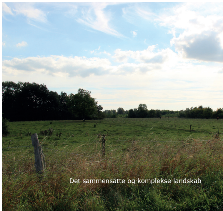
Det sammensatte og komplekse landskab