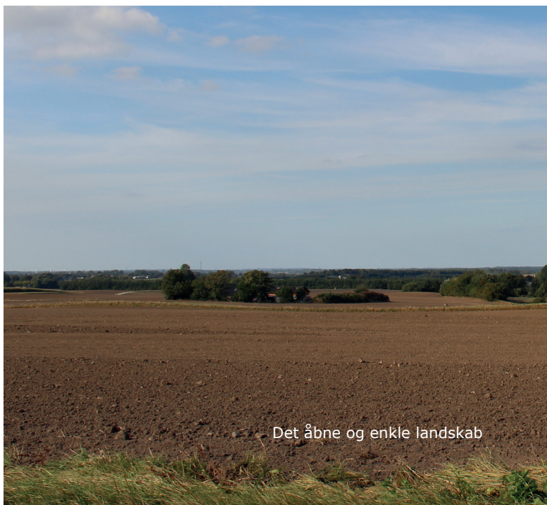
Det åbne og enkle landskab

LKM delen er opbygget, så den for hvert karakterområde giver en kort intro til områdets landskabelige kendetegn, værdier, opmærksomhedspunkter, kulturarv og udvalgte oplevelsespunkter. Herefter følger en landskabskarakterbeskrivelse og vurdering af landskabet samt anbefalinger til planlægningen.